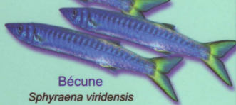
Bécune Sphyræna viridensis Barracuda