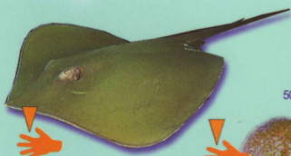
Raie brunette Raja undulata Brown ray