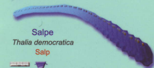
Salpe Thalia democratica Salp