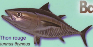
Thon rouge Thunnus thynnus Red tuna