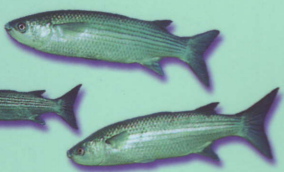
Mulet lippu Chelon labrosus Grey mullet