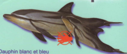
Dauphin blanc et bleu Stenella coeruleoalba Blue and white dolphin