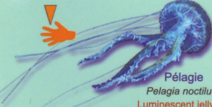
Pélagie Pelagia noctiluca Luminescent jellyfish