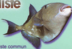
Baliste commun Balistes carolinensis Commun trigger fish