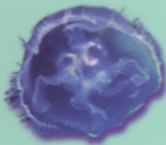
Aurélie Aurelia aurita Moon jellyfish