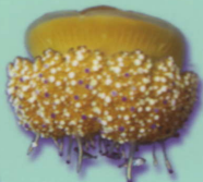
Méduse "Oeuf au plat" Cotylorhiza tuberculata Fried-egg jellyfish