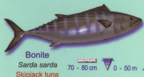
Bonite Sarda sarda Skipjack tuna