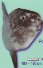
Poisson lune Mola mola Sunfish