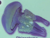
Rhizostome Rhizostoma pulmo Rhizostome