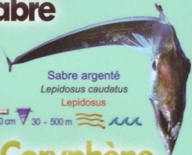
Sabre argenté Lepidosus Lepidosus