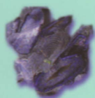
Vélelle Velella velella Porpittidae