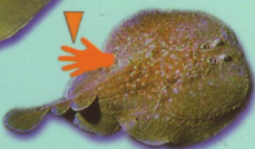
Raie torpille Torpedo marmorata Electric ray