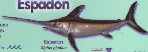
Espadon Xiphias gladius Swordfish