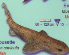
Petite roussette Scyliorhinus canicula Dogfish