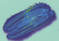
Cténophore Leucothea multicornis Ctenophora