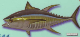
Thon jaune Thunnus albacares Yellow tuna