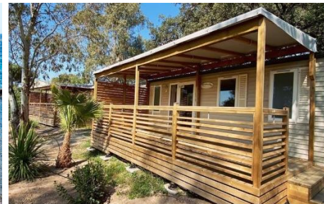
Camping Santa Lucia 2*

Chaque année et pour notre plus grand plaisir, le SPLASH organise des sorties en fin de saison. Afin de préparer au mieux ces voyages, nous avons besoin de savoir combien de personnes sont intéressées pour pouvoir faire les réservations /plongée/restauration/hébergement.