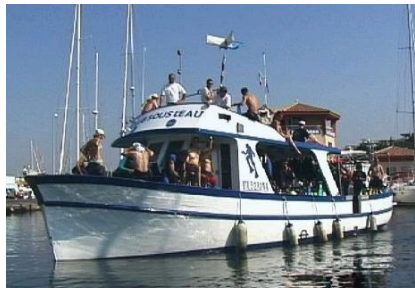
Club Sous l'Eau

Sortie adultes du jeudi 16 mai au lundi 20 mai 2024